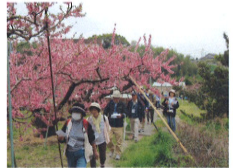
※写真はH26年4月 春のウォークラリーの様子