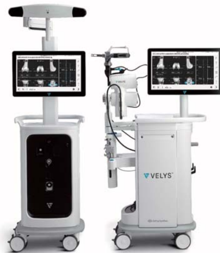
写真 1. VELYS™RAS外観

ロボットを使用した人工膝関節全置換術は保険適応となりますので、従来の手術から費用負担が増えることなく治療を受ける事が出来ます。膝の痛みにお悩みの方は、お気軽にご相談ください。