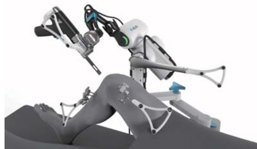
写真 2. VELYS™RAS手術イメージ