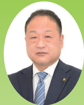
公立那賀病院経営事務組合管理者 紀の川市長

結びに、地域住民の皆さまのご健勝とご多幸を祈念申し上げ、年頭のご挨拶とさせていただきます。