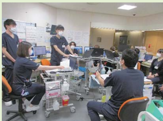
カンファレンス風景