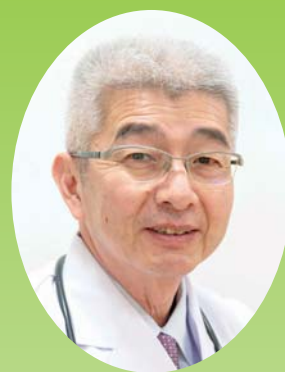
公立那賀病院 院長

加えて、公立那賀病院は地域災害拠点病院としての役割も担っており、今後も地域の皆さまに貢献できるよう、より一層努力を重ねてまいります。