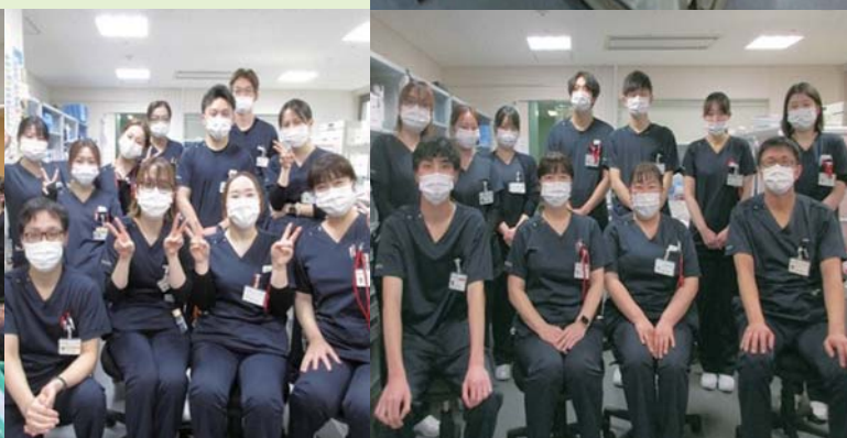
3階南病棟スタッフ